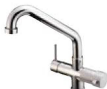
RUBINETTO - FAUCET Monocomando - a 5 vie - canna bassa Single-control - Five-way mixer tap - low cane