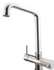
RUBINETTO - FAUCET Monocomando - a 5 vie - canna alta Single-control - Five-way mixer tap - high cane