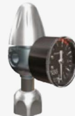
Riduttore per bombole ricaricabili con manometro di bassa pressione assiale Reducer for rechargeable gas cylinders with axial low pressure gauge