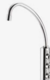
RUBINETTO - FAUCET