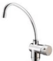
RUBINETTO - FAUCET 3 vie 3 way